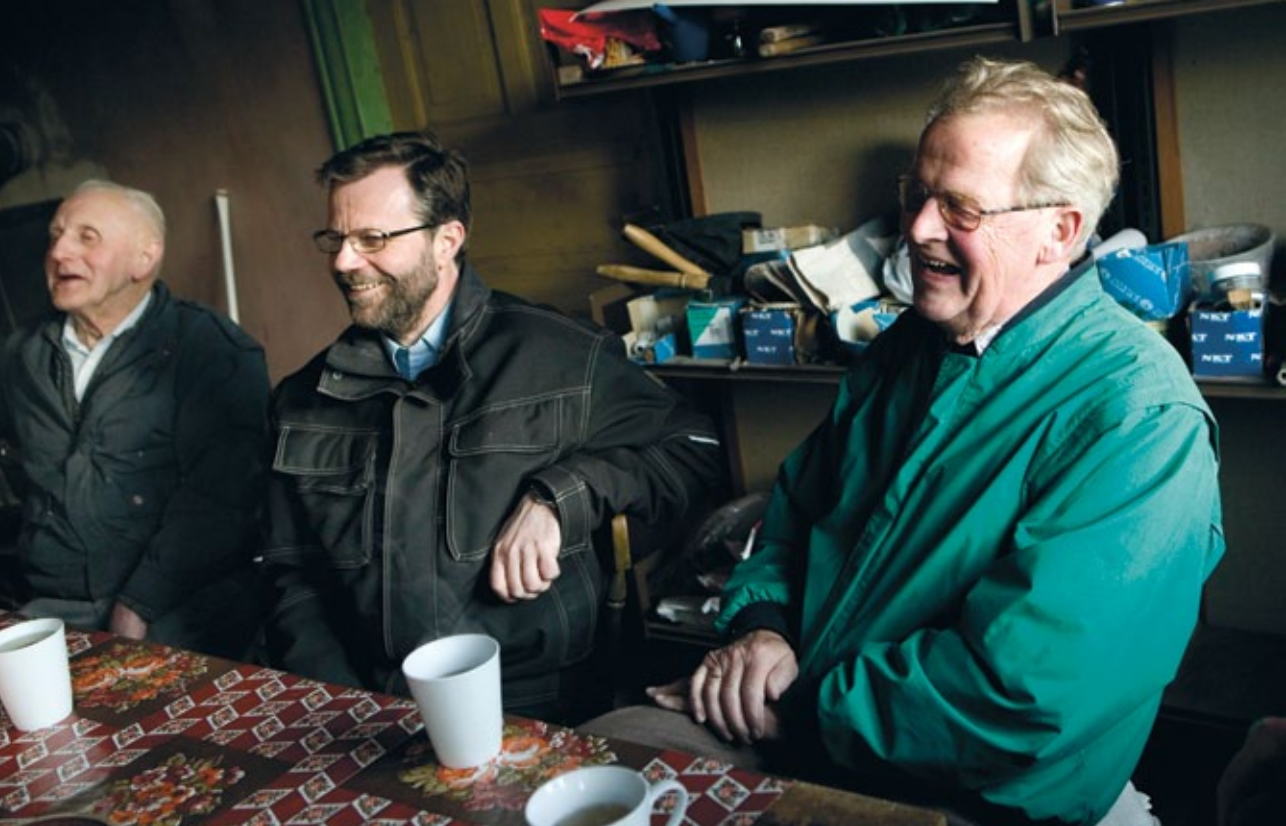
Jollmands Gaard er i allerhøjeste grad et socialt projekt, hvor ildsjælene mødes om en fælles opgave og interesse.

nogle af de første udfordringer, der mødte projektet. “Da først Realdania begyndte at fatte interesse, skal jeg love for, at der begyndte at ske noget. Så var det nemmere at få andre fonde til at give noget.”