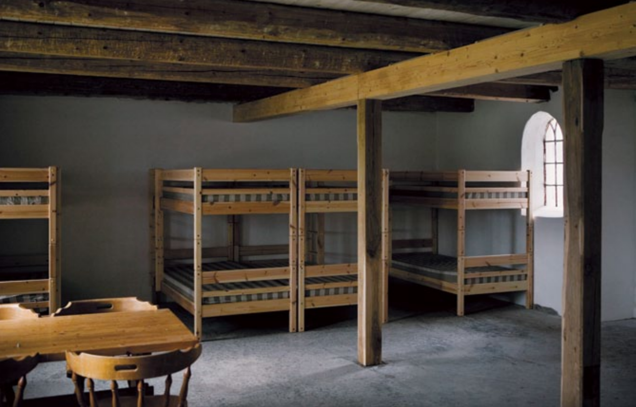
Inden længe bliver soverummene fyldt med vandrende, der går langs Hærvejsruten.

gamle spær træder tydeligt frem i loftet, og vinduernes form og struktur er bevaret.